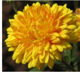
ХРИЗАНТЕМА 'ЗОЛОТАЯ ЮРГА'