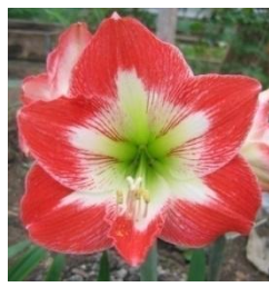
ГИПЕАСТРУМ 'ПАМЯТИ С.Т. АКСАКОВА'