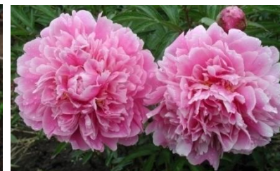
ПИОН 'МУСТАЙ КАРИМ'