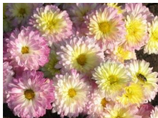
ХРИЗАНТЕМА 'ФИМА БАЙБУРИНА'