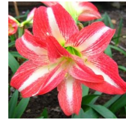
ГИПЕАСТРУМ 'ГАЛИНА ШИПАЕВА'