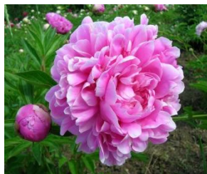
ПИОН 'ЮЖНЫЙ УРАЛ'