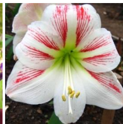
ГИПЕАСТРУМ 'ВЕЛИКИЙ МОЦАРТ'